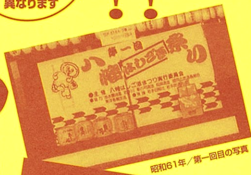
昭和61年/第一回目の写真